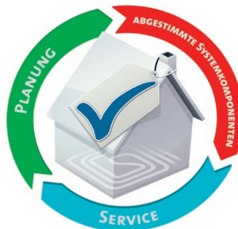
Bild 04: Merkmale eines Systems von einem Hersteller (Markensystem).

Die Systemkomponenten eines Anbieters (Markensystem für die Flächenheizung/-kühlung und/oder Heizkörper) garantieren die Funktionalität des Systems und geben dem Fachbetrieb die Sicherheit im Haftungsfall (siehe Bild 04). Darüber hinaus bietet der Systemhersteller Unterstützung bei der Planung und beim Service.