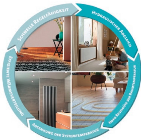
Bild 03: Systemgedanke der Wärmeübergabe (Flächenheizung/-kühlung und/oder Heizkörper).

Daher sollte für die eingebauten Komponenten eine gesamtheitliche objektspezifische System- und Ausführungsplanung, unter Berücksichtigung der produktspezifischen Kennwerte/technischen Daten, vorliegen. Diese Unterlagen sind als Bestandteil der Anlagendokumentation dem Nutzer/Auftraggeber auszuhändigen und im Rahmen der Übergabe zu erläutern (Einweisung!). Dadurch lässt sich für den Auftraggeber nachvollziehen, ob die in der Planung berücksichtigten Systeme/Bauteile auch eingebaut wurden.